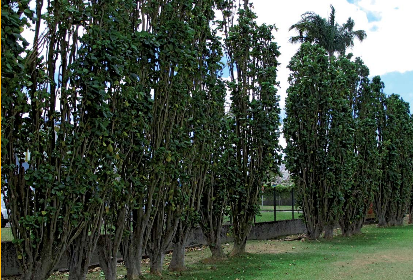
Formation verdoyante d'érythrina ou immortelles, Erythrina variegata var. fastigiata - Cliché Eddy Dumbardon-Martial