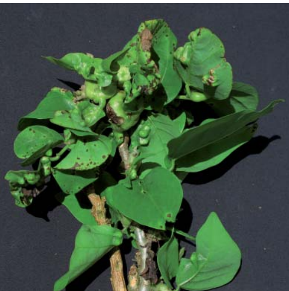
Galles et déformations des organes végétatifs

tion de 1 % de l'aide allouée. Ainsi, cette érythrine remplace rapidement le sandragon ( Dracaena fragans , Dracaenacée) jusque-là utilisé, puis elle s'installe rapidement dans le paysage en formant de véritables bocages typiquement antillais.