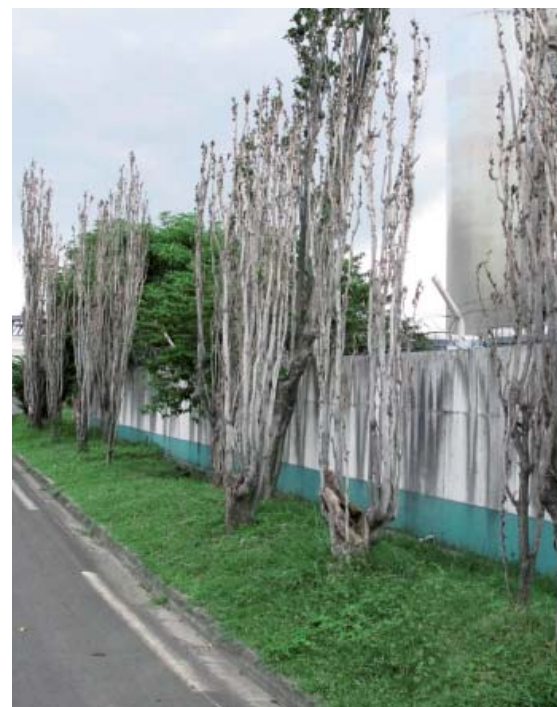
Succession d'arbres morts sur pied après infestation par Quadrastichus erythrinae (N9 à la Pointe des Carrières, Martinique)