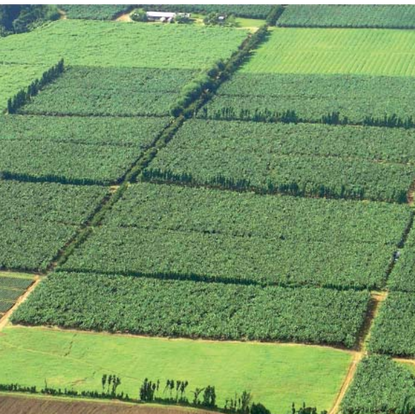
Bananaïes de la commune du Lorrain (Martinique) délimitées par des brise-vent d'Immortelles