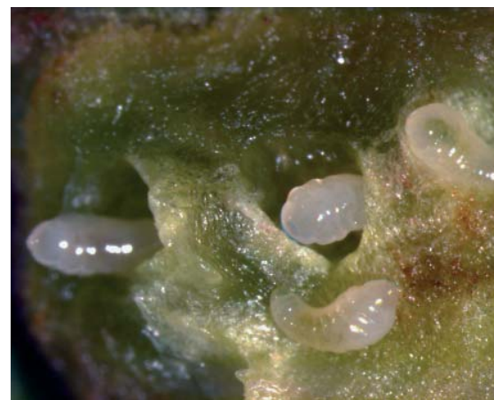
Larves de Quadrastichus erythrinae - Cliché NBAll à : www.nball.res.in/Introductions/Insects/Invasives/Quadrastichus_erythrinae.htm

Dans les jardins antillais, les immortelles sont progressivement remplacées par d'autres arbres et