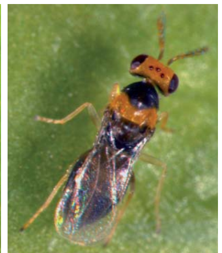
Quadrastichus erythrinae mâle et femelle