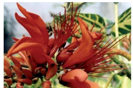
Fleurs d'une immortelle Erythrina variegata var. variegata

de haut. Dans les années 1990, sa capacité à s'adapter à la plupart des conditions pédo-climatiques des deux îles et sa multiplication végétative aisée font d'elle une espèce de choix dans la constitution des haies. Au début des années 2000 la mise en place et l'entretien des haies de cette immortelle s'inscrivent très vite dans des mesures relatives aux